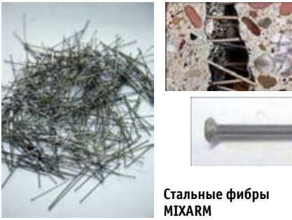
Стальные фибры MIXARM

мании, Норвегии, США, Франции, Японии и в других странах. В нашей стране также активно ведутся исследовательские работы по внедрению СФБ в строительную практику.